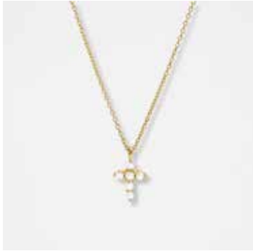
AUN04DVK - 299,00 €