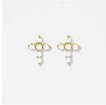
AUE09DVK - 279,00 €