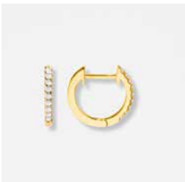
AUE08DVK - 349,00 €