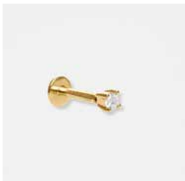
AUPIR03DVK - 149,00 €