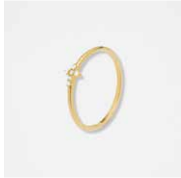
AU2003DVK - 299,00 €