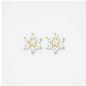
AUE10DVK - 299,00 €

Diseños en Oro de Ley de 18 quilates con diamantes