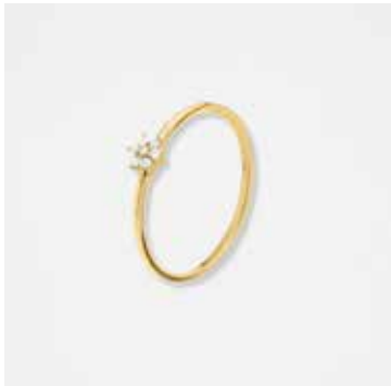
AU2004DVK - 299,00 €