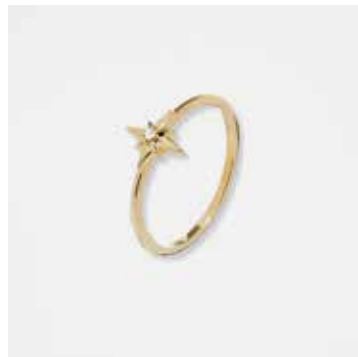
AU2006DVK - 329,00 €