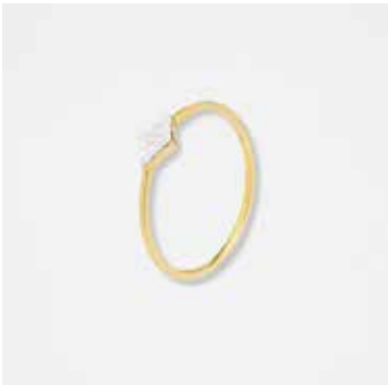
AU2007DVK - 379,00 €