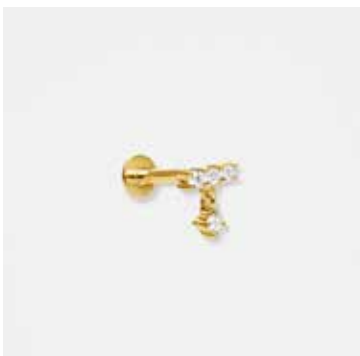
AUPIR05DVK - 199,00 €