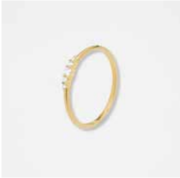
AU2002DVK - 339,00 €