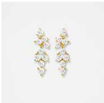
AUET11DVK - 359,00 €