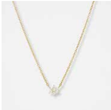
AUN05DVK - 299,00 €