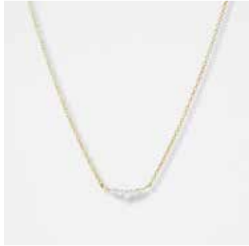
AUN03DVK - 349,00 €