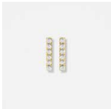
AUE15DVK - 279,00 €