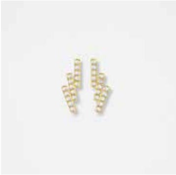
AUE13DVK - 449,00 €