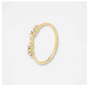
AU2005DVK - 399,00 €