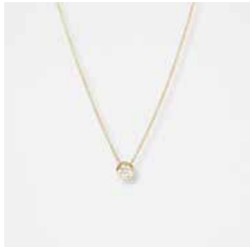
AUN02DVK - 319,00 €