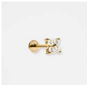
AUPIR01DVK - 179,00 €