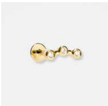
AUPIR04DVK - 179,00 €