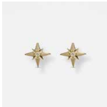
AUE12DVK - 299,00 €