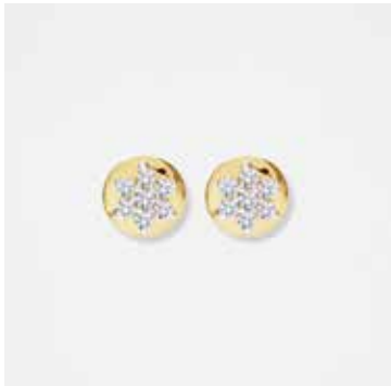
AUE07DVK - 299,00 €