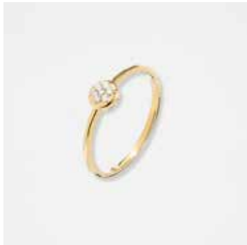
AU2001DVK - 299,00 €