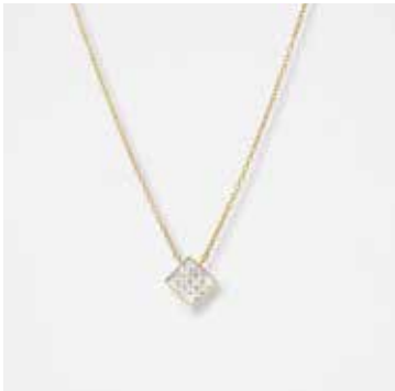
AUN01DVK - 399,00 €