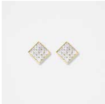
AUE06DVK - 449,00 €