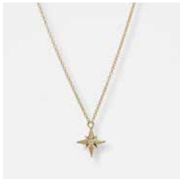
AUN07DVK - 349,00 €